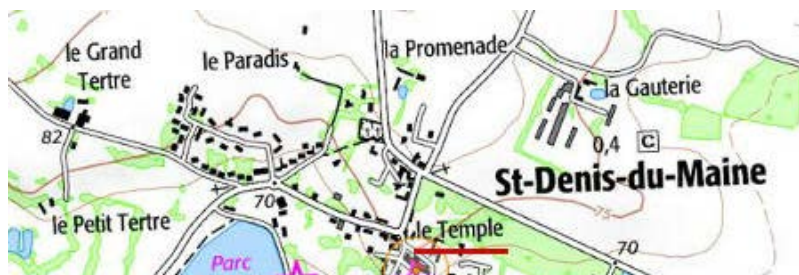
Localisation: Le Temple de Saint-Denis-du-Maine

Département: Mayenne, Arrondissement: Laval, Canton: Meslay-du-Maine, Commune: Saint-Denis-du-Maine - 53