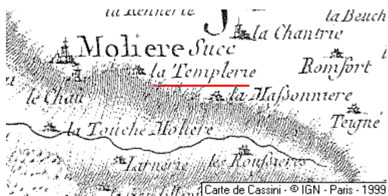
Localisation: La Templerie-de-Molière

Templerie-de-Molière (La), ferme, sur la commune de Chemazé.