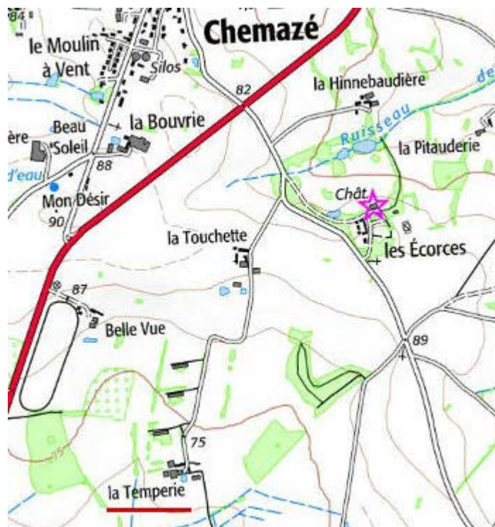
Localisation: La Templierie de Chemazé

Templierie (La), ferme, sur la commune de Chemazé.