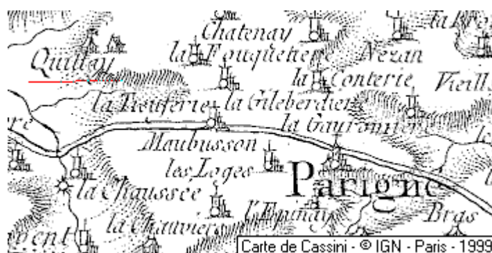
Localisation: Maison du Temple de Quittay

Département: Mayenne, Arrondissement et Canton: Mayenne, Commune: Saint-Georges-Buttavent - 53