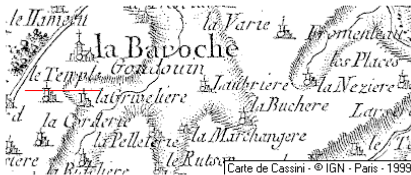
Localisation: Le Temple de Baroche-Goudouin

Temple (Le), ferme, sur la commune de la Baroche-Goudouin.