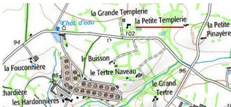
Localisation: La petite et la grande Templierie de Longuefuye

Département: Mayenne, Arrondissement: Château-Gontier, Canton: Azé, Commune: Longuefuye - 53