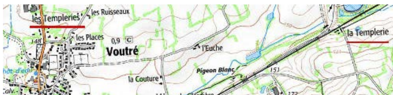
Localisation: La Templerie de Voutré

Département: Mayenne, Arrondissement: Laval, Canton: Evron, Commune: Voutré - 53