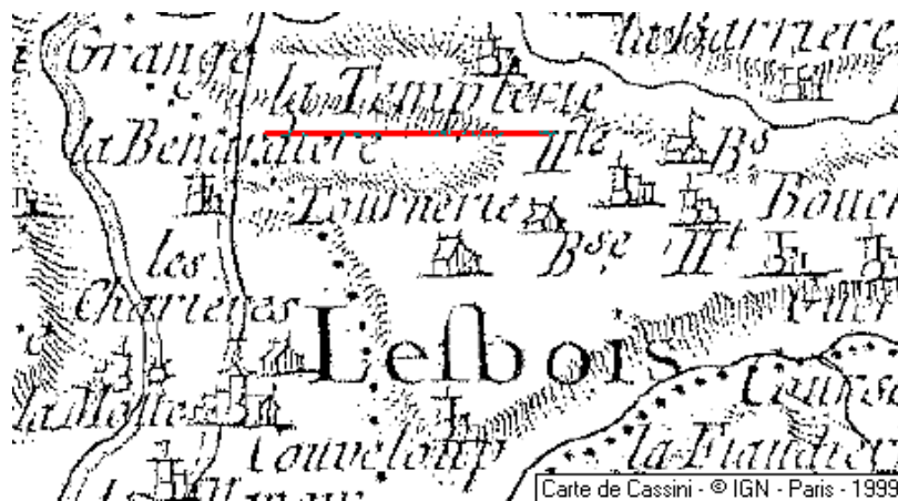
Localisation: La Templierie de Lesbois

Templierie (La), village, sur la commune de Lesbois.